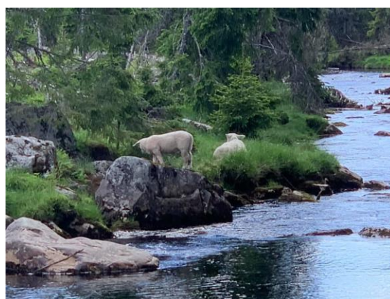
Vandring langs Finnøla.