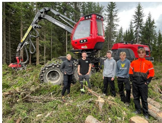
Fagdag med JOB:U gjengen, besøk hos Lierhagen skogsdrift.