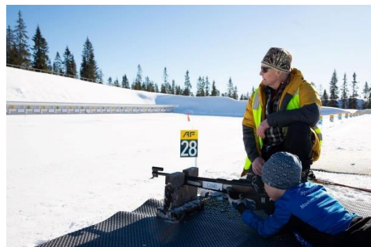
RASKO dagene, skiskyting er en populær sport for ungdommen å teste ut.