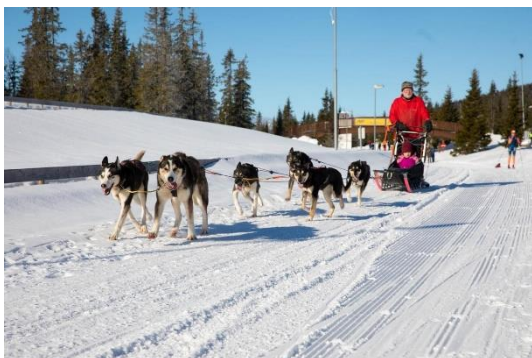
RASKO dagene, full fart med hundekjøring.

Arrangementet ble godt mottatt fra ungdommene. ASKO bidro med servering gjennom arrangementet. Vi vil rette en stor takk til alle som deltok ved planlegging og gjennomføring.