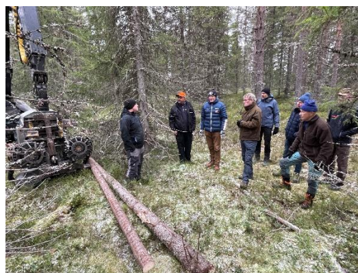
Befaring av tynning ved Sør-Mesna.