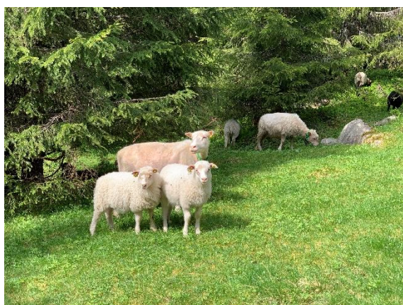
Sauer på beite i Åsmarka.

Det er innført kvote for totalt antall beitedyr som kan tillates i beiteområdet. Egne retningslinjer er utarbeidet i Beiteutvalget. Det er forgrunnlaget som bestemmer antall dyr som kan slippes på det enkelte bruk. Ansvar for oppfølging av de fastsatte bestemmelser ligger til de enkelte lokallagenes styre.