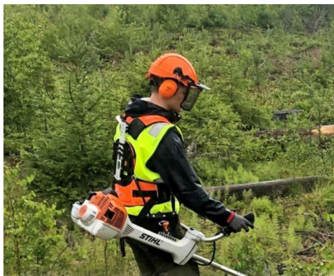
JOB:U 2023 i full sving med ryddesag.

Det var 4 ungdommer som arbeidet for Ringsaker Almenning i 2023 gjennom JOB:U prosjektet. JOB:U er med på å skape arbeidserfaring og innføring i skogbruket.