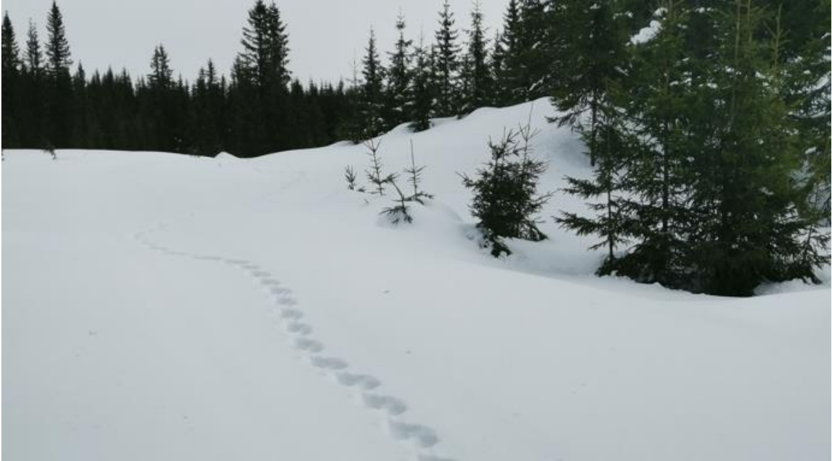
Jervespor ved Mesnabakken