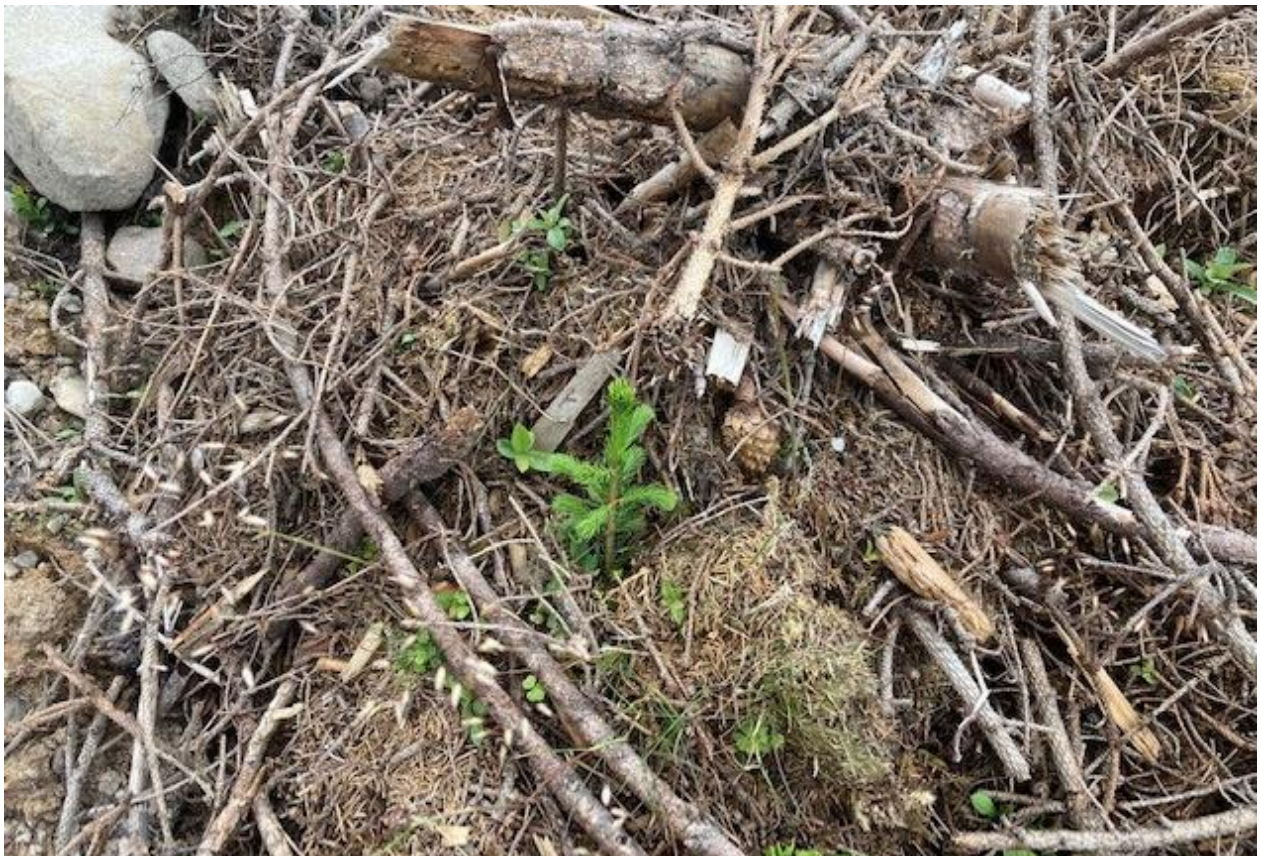
Skogen forvaltes i et langsiktig perspektiv

Loven og bruksreglene er rammene for allmenningsstyrets arbeid og løpende strategi.