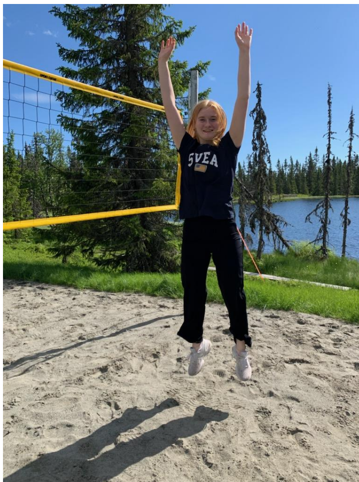
Volleyball ved Eftastjernet

Arrangementet ble avlyst i 2020 og 2021, men er planlagt gjennomført kommende vinter